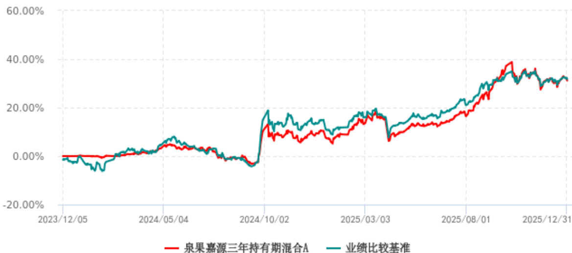
泉果嘉源三年持有期混合A累计净值增长率与业绩比较基准收益率历史走势对比图 (2023年12月05日-2025年12月31日)